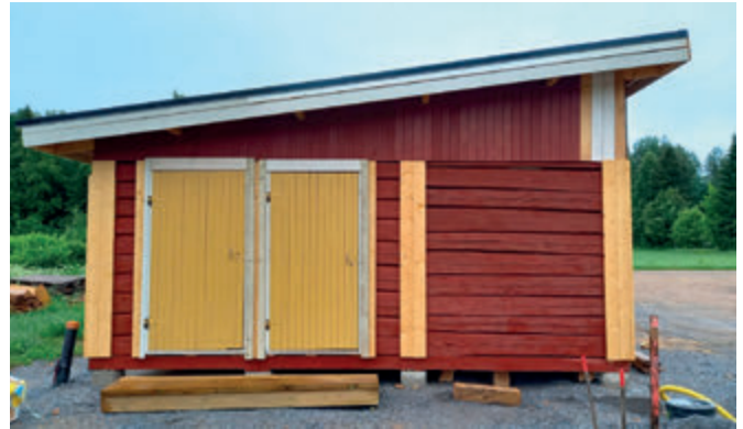
Rautajärveläisten keittämällä punamullalla maalattu piharakennus.